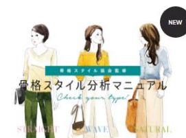
自分の骨格タイプを知れば「似合う」がわかる！骨格スタイル分析マニュアル