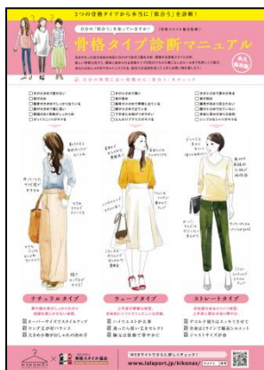
骨格診断マニュアル