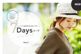
ファッションディレクター野尻美穂の小物哲学 シンプル服を夏小物で盛り上げる7Daysコーデ Part.1