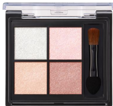
01 オーガンジーピンク