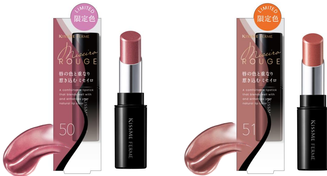
50 スモーキーフィグ

3月に発売したキスミー フェルムの「ミセイロージュ」から、完熟した秋の果実のようなモーヴカラーと、とろけるスイーツのような甘さのヌーディーカラー2色が登場。唇にのせた瞬間に溶けだし、スルスルととろけるような塗り心地を実現。塗布後は密着ジェル膜を形成し、塗リたての発色とツヤ感をキープします。