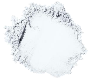
01 クリスタルシマー