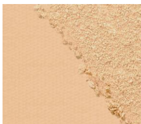
03 ベージュオークル 黄みよりで明るめ