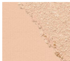
10 ピンクオークル 赤みよりで明るめ