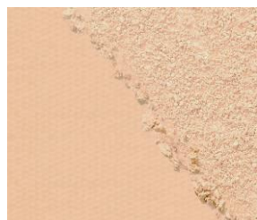
01 ライトオークル 明るめ