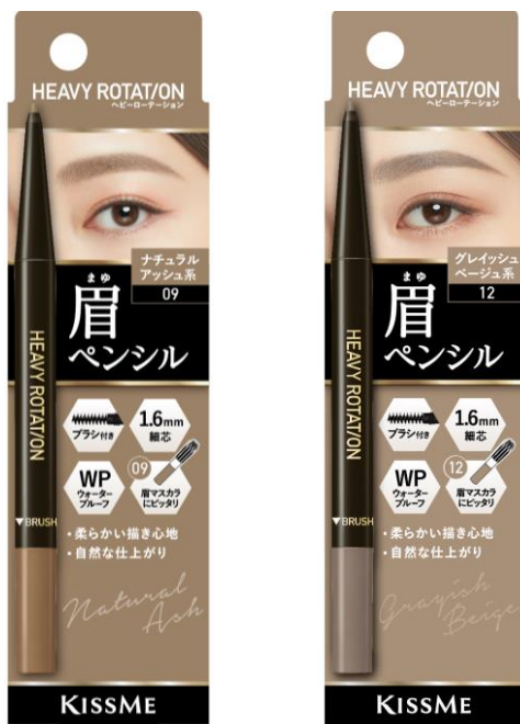
09 ナチュラルアッシュ系

簡単にナチュふわ眉が叶うと人気のアイブローペンシルから、アッシュ系の髪色や暗髪、黒髪に合わせやすいカラーが新登場。やわらかい描き心地とふんわりぼかせるブラシ付きで、自然な仕上がりに。ウォータープルーフ処方で、美しい眉を長時間キープします。ヘビーローテーションの大人気アイテム「カラーリングアイブロー」の人気色と対応したカラー展開で、合わせ使いすることで、あか抜け眉を演出します。