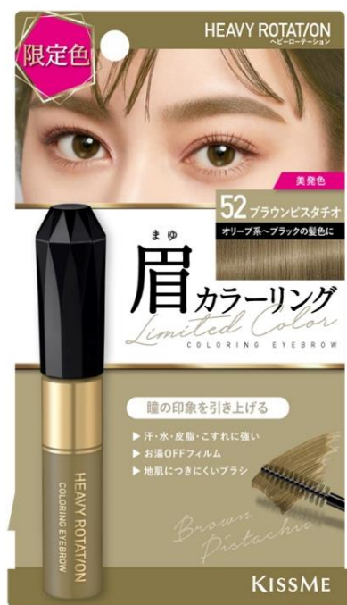
52 ブラウンピスタチオ

「キスミー ヘビーローテーション カラーリングアイブロウ」から、 絶妙ニュアンスカラーでトレンド感たっぷりの限定2色が登場！ スツと顔に馴染むピスタチオカラーは、目もとを際立たせ、いつもと一味違う大人っぽ眉に。 まろやかなココアカラーは、自眉の印象を抑えてふんわりとした雰囲気感を纏わせ、柔らかい印象に。 高発色処方で、自眉が濃い方でもサッとひと塗りであか抜け眉を叶え、 秋・冬を感じさせるトレンド感のある眉メイクが楽しめます。