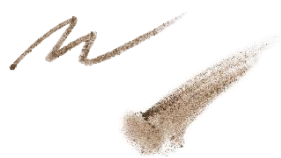
02 ウッディブラウン ほんのり赤みのある ナチュラル系ブラウン