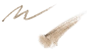
01 サンドベージュ 肌なじみの良い自然な アッシュ系ライトブラウン