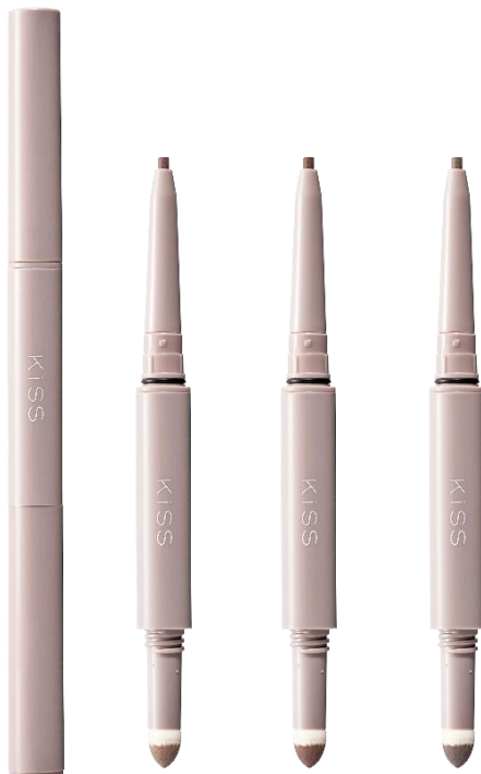
左から 01 サンドベージュ、02 ウッディブラウン、03 アッシュキャメル

1本で自然な美眉が描けるWエンドタイプの眉ペンシル&眉パウダーがリニューアル！ カラー設計と描き心地をパワーアップさせて新登場します。 なめらかな繊細ラインが描けるスリムなペンシルと、 自然にぼかせるパウダーで、自眉のようなふさっと感を表現。 どのような肌色・髪色にも馴染むように設計された、 抜け感抜群の柔らかなアッシュトーンカラーが3色展開。 顔全体の調和を生み出すような、ふんわりとした今っぽ垢抜け眉に仕上げます。