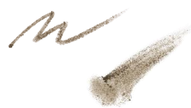
03 アッシュキャメル ほんのり黄みのある アッシュ系ブラウン