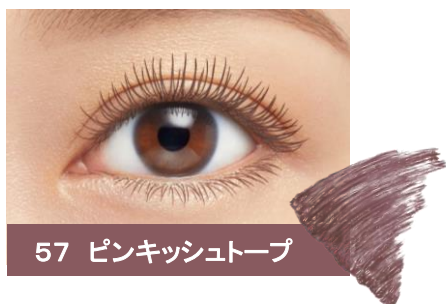
57 ピンキッシュトープ