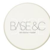
スキンバリアパウダー ¥1,700 (税込¥1,870)