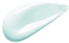
01 Lagoon Mint 肌のくすみを補正するミントカラー

◇グリーンとブルーのいいとこ取りをした中間色のラグーンミント。 絶妙なミントカラーで、透明感のある肌印象へ導きます。