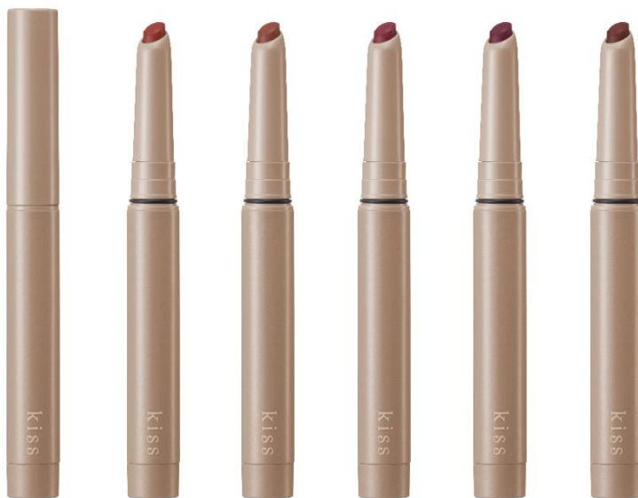
左から 01 FLOWER HAZE、02 PERSIMMON MANIA、03 CHAI ROZE、04 OLD PLUM、05 VINTAGE CACAO