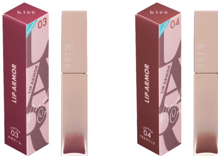
左から X03 ロゼビーム、X04 くちどけフィグ

今までになかった“ツヤ×うるおい×落ちにくい”仕上がりで人気の 次世代ティントリップ「キス リップアーマー」から、ローズカラーコレクションが数量限定で新登場！ 普段使いから冬のイベントにも使いやすい華やかなカラーで、大人っぽい印象に仕上がります。 唇に色が密着し、「透明ジェル膜」が唇をコート。濡れたような光沢感がありながら、ティッシュオフしなくても 色移りせず、つけたての発色が1日中※2続きます。