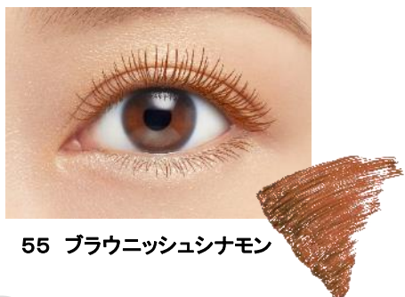
55 ブラウニッシュシナモン