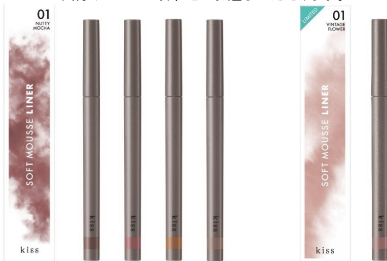
左から 01 ナッツィモカ、02 チェリーボンボン、03 キャラメルグラッセ、04 プードルファー、X01 ヴィンテージフラワー

“kiss”から、濃すぎず柔らかな発色のふんわりラインで 抜け感を引き出しながら目もとを際立たせる、ふわ締めライナーが新登場！ 光を拡散するブライトパールがラインの輪郭を肌になじませ、 強すぎないシアード発色の締め効果でナチュラルに目力をアップ。 抜け感のある今っぽい囲み目メイクが完成します。 デイリーに使いやすいトレンド感のあるカラーラインアップで 気分やシーンに合わせてお選びいただけます。