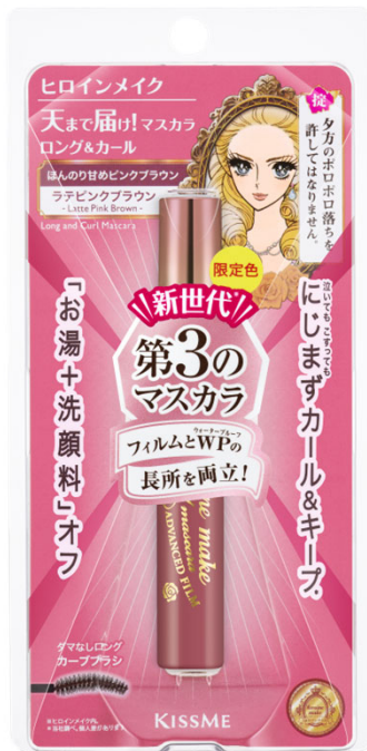
52 ラテピンクブラウン

フィルムとウォータープルーフの長所を両立！ ヒロインメイクの「第3の mascara」から、数量限定のブラウンコレクションが新登場。 普段使いもしやすい抜け感まつ毛が叶うくすみブラウンの3色展開。 上向きロングまつ毛を長時間キープし、印象的な目もとを演出します。