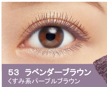
53 ラベンダーブラウン くすみ系パープルブラウン