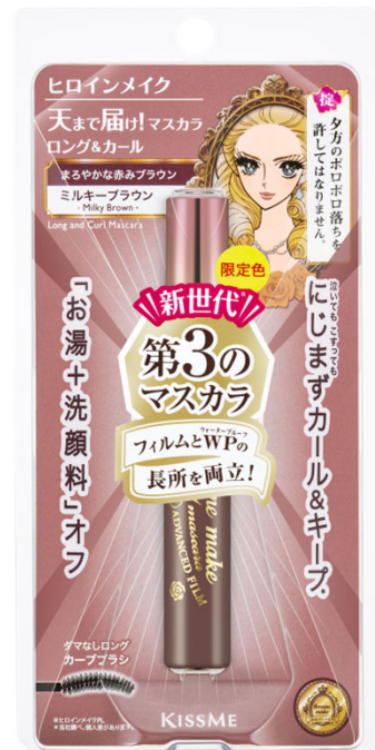
54 ミルクィーブラウン