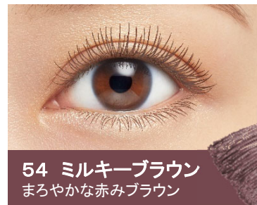
54 ミルキーブラウン まろやかな赤みブラウン