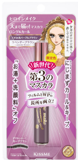
53 ラベンダーブラウン