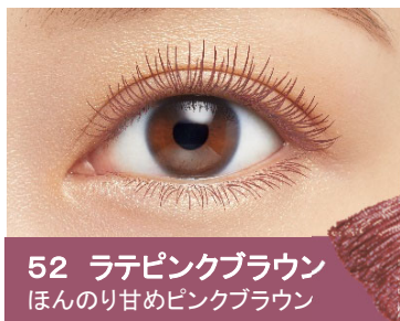
52 ラテピンクブラウン ほんのり甘めピンクブラウン