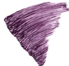
50 フルール バイオレット

白残りしない自然に馴染むラベンダーカラーで、塗り残しが目立ちません。 ニュアンスパール入りのパープルでほの甘なこなれ感を演出します。