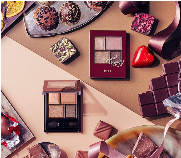
左:01 Sweet Chocolat 右:02 Bitter Chocolat

質感ミックスで、ツヤやかに目もとを彩る“kiss”の人気アイカラーパレットから、 バレンタインシーズンにぴったりのチョコレートをイメージした限定2色が新登場！ 甘さに優しさとほろ苦さをプラスしたカラー展開で 気分に合わせてビターなニュアンス、スウィートなニュアンスをお楽しみいただけるパレットです。 グリッター・マット・パール異なる3つの質感で、上品なツヤや抜け感のある目もとに仕上げます。 バレンタインだけのレッドブラウンカラーの限定容器もトキメキをプラスします。