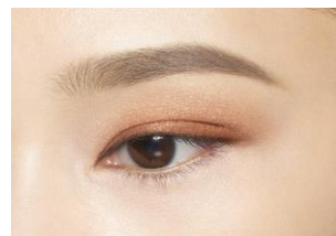
09 ブラウン系 使用イメージ