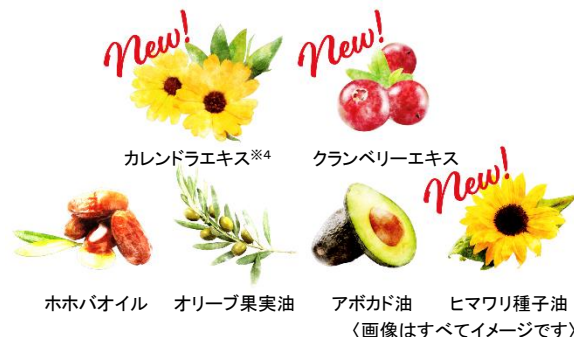
ホホバオイル オリーブ果実油 アボカド油 ヒマワリ種子油 (画像はすべてイメージです)