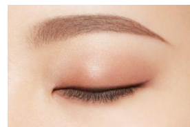
02 ナチュラルブラウン (濃ブラウン~ブラック系の髪色に)