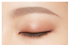
01 アッシュブラウン (やや明るいブラウン系の髪色に)