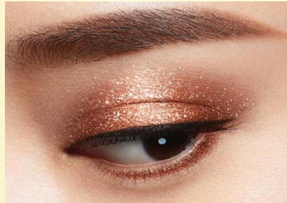
02 アップタウンガール