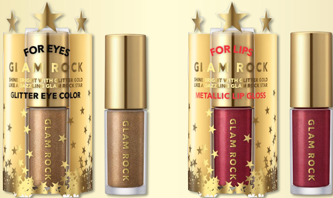
グリッターダズル アイズ

大粒グリッターが大胆に輝くりキッドアイシャドウと、 メタリックな光沢感のあるリップグロスを新発売します。 印象的な煌めきがグラマラスでありながら上品な仕上がりで、 普段使いでも活躍するアイテムです。