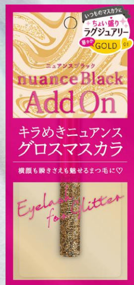
ニュアンスブラック グロスマスカラ 6g ¥1,500(税抜) 全2色

目もとに存在感を与える黒に、遊び心をブレンド。 さり気なく色が瞬くカラーニュアンスで、 目もとをファッショナブルに愉しめる。