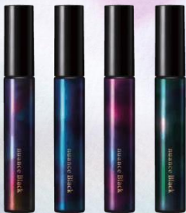
01 フェミニンブラック 02 スマートブラック 03 レディブラック 04 スタイリッシュブラック