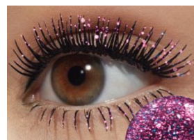
02 スウィート ティア