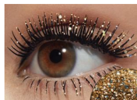
01 ブリリアント ティア

シアーなブラックに、2色のキラめくらメをブレンド。 品のあるリクスな色設計で、瞬きするたび 魅せる目もとに。