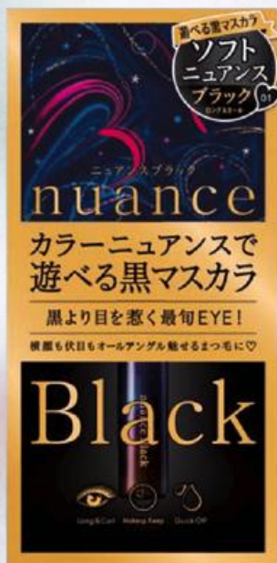
ニュアンスブラック ロングカーブ マスカラ 7g ¥1,800(税抜) 全4色