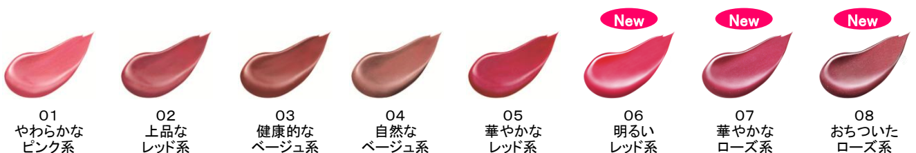
01 やわらかな ピンク系