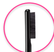
セパレートメイクブラシ