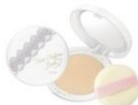
マットシフォン パクトUV