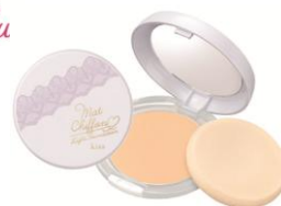
マットシフォン ライトファンデーションUV