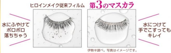
伊勢半調べ。写真はイメージです。