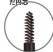
ぼかしやすい ブラシ付