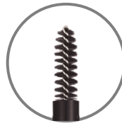
ぼかしやすい ブラシ付

キスミー フェルムは、日本初のセルフメイクアップブランドです。 SINCE 1966