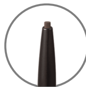
描きやすい だ円芯