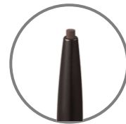
描きやすい だ円芯