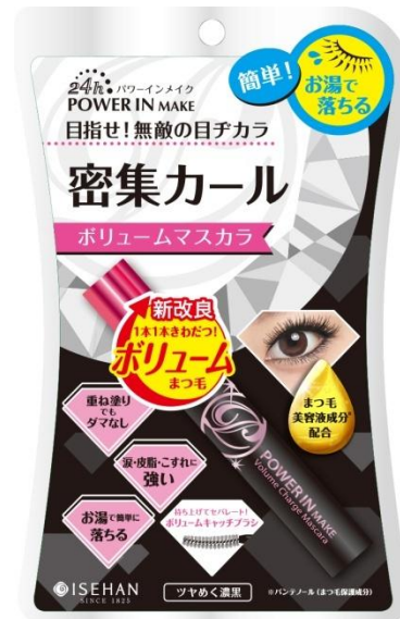
パワーインメイク ボリュームチャージマスカラEX