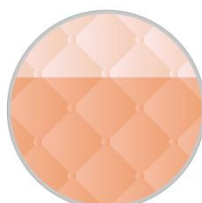
Orange Waltz 03