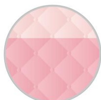
Aristo Pink 01