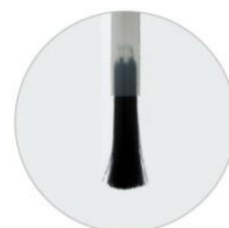
柔らかくしなやかな毛質のハケ