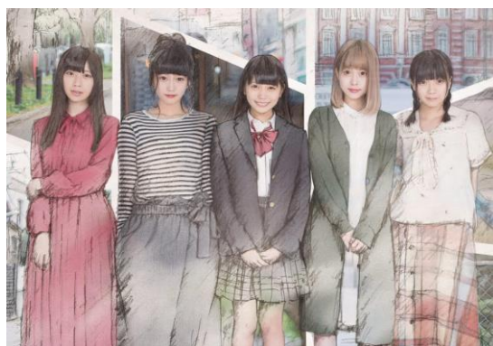
まねきケチャ (コレットプロモーション)

上記除く出演予定のアーティスト(2017年1月10日時点) LinQ、drop、THE HOOPERS、PiiiiiiN、大阪☆春夏秋冬 他数組