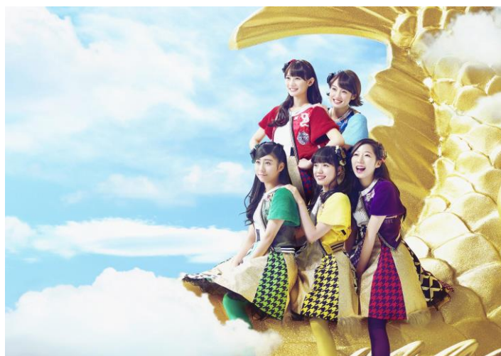
チームしゃちほこ (スターダストプロモーション)