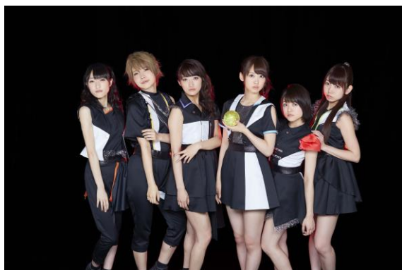
i☆Ris (エイベックス・ピクチャーズ)