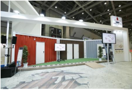
▲実物展示されたクレイドルキャビン