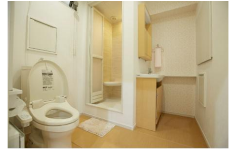
▲トイレ・シャワータイプ

「危機管理産業展(RISCON TOKYO)2016」で初披露されたクレイドルキャビンは、避難所等に運搬・設置可能な災害時宿泊ユニットです。精神的にも肉体的にも負担が多い避難所や、車中泊の生活を長続きさせない為、短時間で住宅供給を可能にし、プライバシーの守られた快適な空間をご提供いたします。また、寝室タイプや、トイレ・シャワーのついたタイプなど、様々なクレイドルキャビンをご用意しており、用途に合わせた空間を作り出す事が出来ます。本展示会では、クレイドルキャビンの実物展示を行いました。ひと際目を引く、実物のクレイドルキャビンに多くの方々立ち止り、実際に中に入って、備え付けられているカプセルタイプのベッドや、トイレ等を真剣に見学していました。