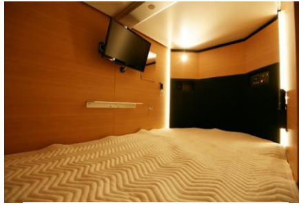
▲ハイグレード寝室タイプ