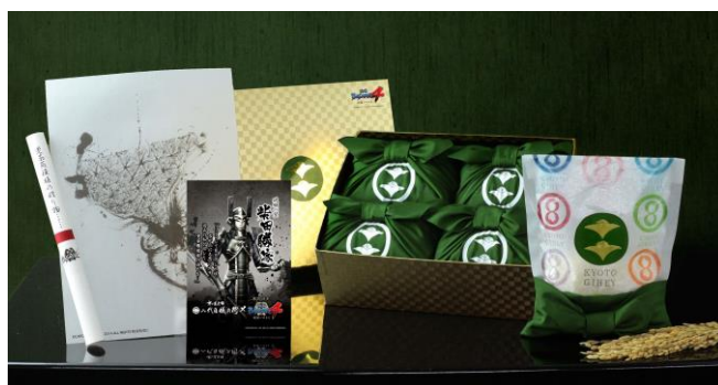
「戦国 BASARA®4 武将米シリーズ 柴田勝家」 3,000 円(税別)