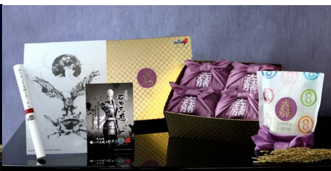
「戦国 BASARA®4 武将米シリーズ 石田三成」 3,000 円(税別)