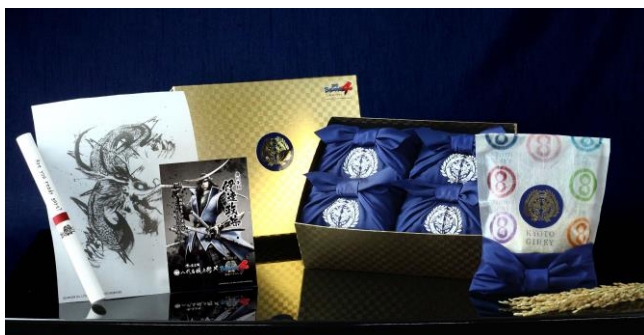
「戦国 BASARA®4 武将米シリーズ 伊達政宗」 3,000 円(税別)

武将のイラストをプリントしたオリジナルプロマイド(非売品)、各武将がゲーム作中に繰り出す事が可能な必殺技「戯画バサラ技」にも使用されている各武将をイメージした墨絵の「戯画」をプリントした特別な写紙を同梱お届けします。特別限定版のセットは、各武将の家紋を刺繍した紫色の風呂敷で包まれ、更に限定感が高まった商品となっています。