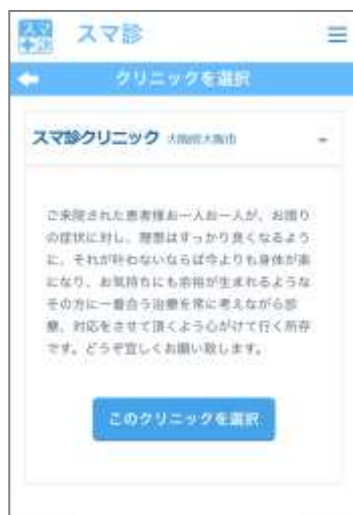
▲ 複数のクリニックから好みのクリニックを選択できる