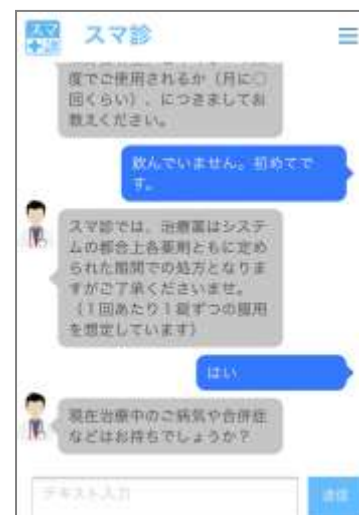
▲ 医師によるチャット形式の診察