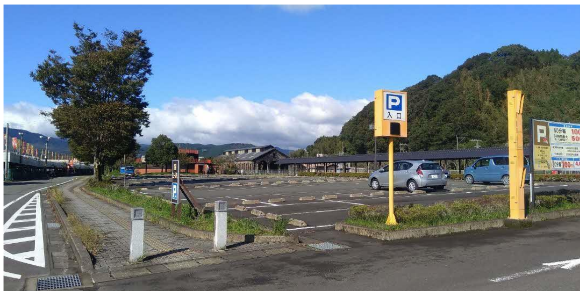
敷地となる人吉駅前広場駐車場