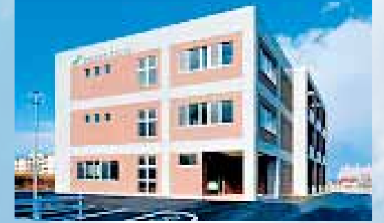
北大ビジネス・スプリング(略称:北大BS)

■北大BSにおいて設置されている「機能性部会」、「AI/IoT部会」との連携により、新たな情報発信等を行います。