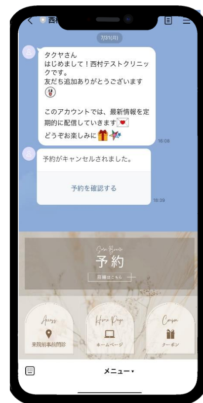
患者の予約画面イメージ

リソースを正しく反映したカレンダーは部屋・機器空き状況を簡単に確認でき、使用機器・部屋の重複を防ぐとともに、予約管理コストを削減します。