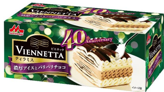
<ビエネッタ ティラミス(40周年パッケージ)>