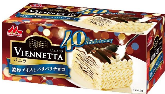
<ビエネッタ バニラ(40周年パッケージ)>

2023年9月に40歳の誕生日を迎えるビエネッタが華やかにドレスアップした「40周年パッケージ」にて、9月25日(月)より数量限定で発売いたします。