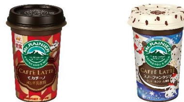
モカチーノ / スノーファンタジア ~クッキー&クリーム風味~