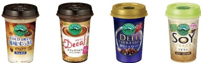
コールドブリュー / デカフェ / ディープ / ソイラテ 後味すっきり / エスプレッソ