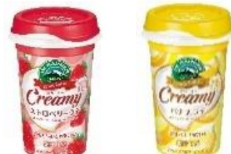
クリーミー / クリーミー ストロベリーラテ / バナナラテ