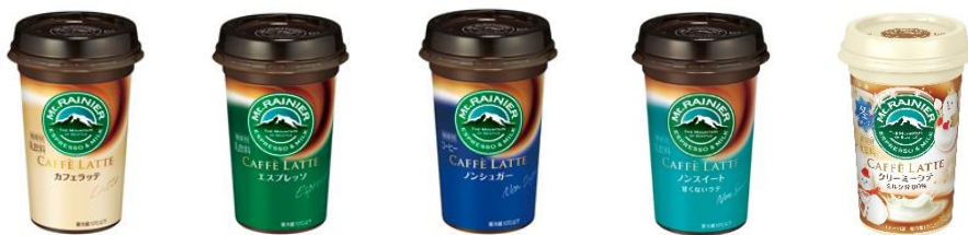
カフェラッテ / エスプレッソ / ノンシュガー / ノンスイート / クリーミーラテ