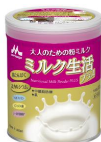
ミルク生活プラス