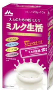
ミルク生活 スティック 10 本