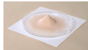
<ラクトフェリン粉末>

ラクトフェリンは人などの哺乳類の乳汁や唾液などに含まれるたんぱく質で、さまざまな生理機能を示すことが知られています。中でも母乳、特に初乳に多く含まれており、生まれたばかりの赤ちゃんを守る重要な成分として考えられています。