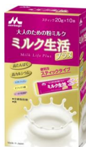
ミルク生活プラス スティック 10 本