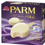
PARM(パルム) ロイヤルミルクティー (6本入り)