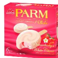
PARM(パルム) ストロベリー&ホワイトチョコ (6本入り)