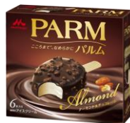
PARM(パルム) アーモンド&チョコレート (6本入り)