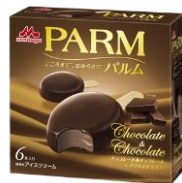
PARM(パルム) チョコレート&チョコレート ~プラリネ仕立て~ (6本入り)