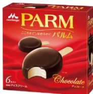
PARM(パルム) チョコレート (6本入り)