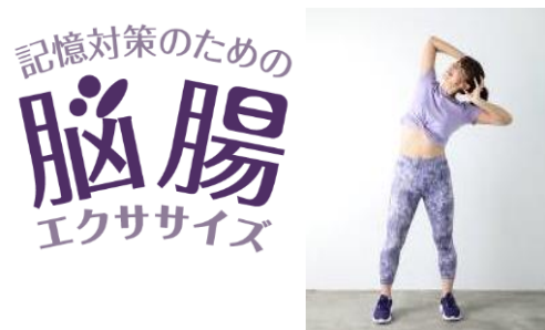
頭をマッサージしながら腸を伸ばす