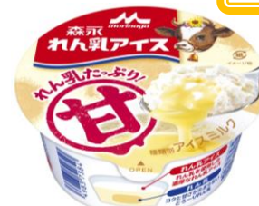
「森永 れん乳アイス」140円(税別)