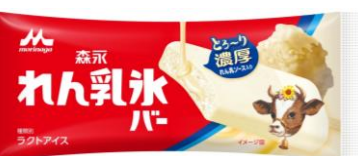
「森永 れん乳氷バー(1本入り)」 140円(税別)