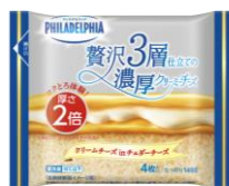
フィラデルフィア 贅沢3層仕立ての濃厚クリーミーチーズ