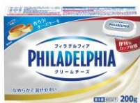
フィラデルフィア クリームチーズ

世界中で愛されて130年以上の歴史を持つ、伝統あるフィラデルフィアブランドのクリームチーズです。