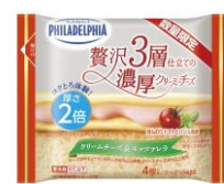
フィラデルフィア 贅沢3層仕立ての濃厚クリーミーチーズ ほんのりトマトとバジル風味