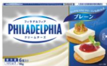
フィラデルフィア クリームチーズ 6P プレーン/ブラックペッパー