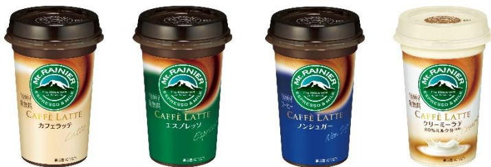
カフェラッテ / エスプレッソ / ノンシュガー / クリーミーラテ