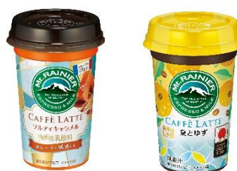
ソルティキャラメル / 夏とゆず ～ロレーヌの風感じる～