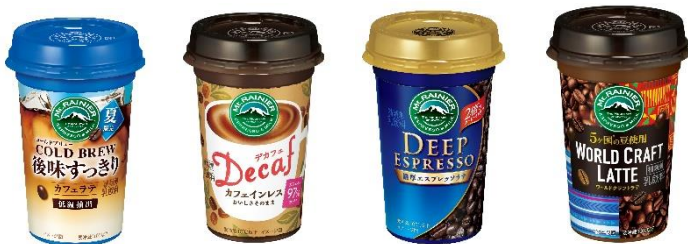
コールドブリュー / デカフェ / ディープ エスプレッソ / ワールド クラフトラテ