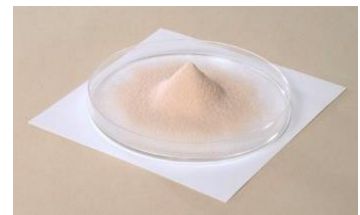
<ラクトフェリン粉末>

中でも母乳、特に初乳に多く含まれており、抵抗力の弱い赤ちゃんを病原菌やウイルスなどの感染から守る重要な成分として考えられています。