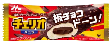
チェリオ バニラ(1本入り) 希望小売価格:140 円(税別) 内容量:85ml