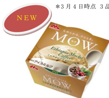
MOW(モウ) エチオピアモカコーヒー

プレミアムアイスクリームでも使われる、国産の脱脂濃縮乳やクリームといった液状乳原料を使用した、濃厚でコクのあるバニラアイスです。芳醇なバニラの香りと、後味のすっきり感が楽しめる味わいに仕上げました。