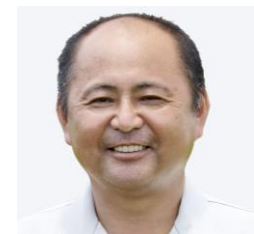
No.5:しろう農園 11月19日(月)13:00