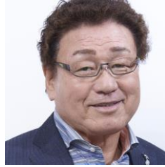
No.2:天龍源一郎 11月16日(金)6:00