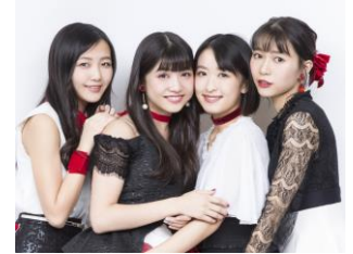
No.8:東京女子流 11月21日(水)6:00