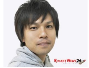
No.4:ロケットニュース24 11月19日(月)6:00