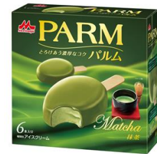
PARM(パルム) 抹茶(6本入り)