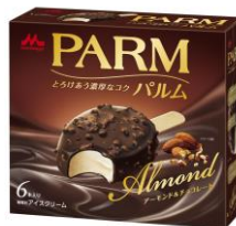
PARM(パルム) アーモンド&チョコレート (6本入り)