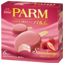
PARM(パルム) ストロベリー(6本入り)