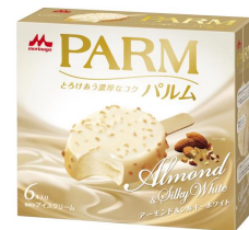
PARM(パルム) アーモンド&シルキーホワイト (6本入り)