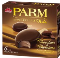
PARM(パルム) チョコレート&チョコレート ~ブラリネ仕立て~ (6本入り)