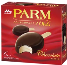
PARM(パルム) チョコレート(6本入り)